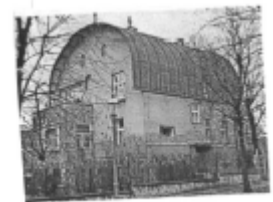
I riferimenti possibili

Così come previsto dall'art. 21.a delle Norme Generali, l'ambito è sottoposto a preventiva redazione di Piano Particolareggiato di iniziativa