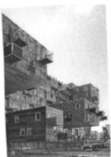
I riferimenti possibili