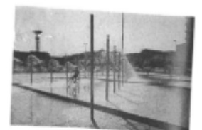
I riferimenti possibili