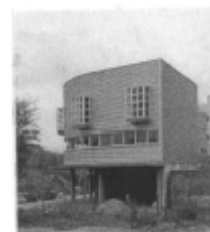
I riferimenti possibili

Indice fondiario: IF = 1.2 mq/mq Rapporto di copertura RC = 0,30 mq/mq Distanze tra i fronti finestrati: De = 10 m Distanze tra i fronti non finestrati: De = 10 m Distanze minime dai confini: Dc = 5 m Numero massimo dei piani fuori terra: 8 Altezza massima: 25 m Solo per i bassi fabbricati di cui all'articolo 9 delle Norme generali, Dc=0 con atto di vincolo tra i proprietari