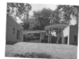
I riferimenti possibili

Le nuove case si collocano in prossimità del Campo volo, tra spazi verdi alberati. Esse, circondate da giardini e cortili, daranno luogo a parti di città poco dense; su strada il limite tra spazio pubblico e spazio privato dovrà essere realizzato da siepi e elementi verdi eventualmente supportati da recinzioni a giorno.