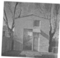
I riferimenti possibili

Il progetto per l'area a servizi – il parco entra in città - dovrà essere definito attraverso concorso di progettazione .