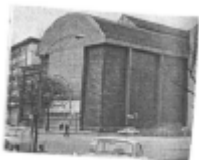
I riferimenti possibili