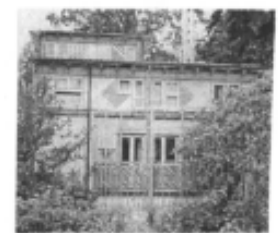
I riferimenti possibili

Le attività complementari sono ammesse unicamente nell'ambito degli edifici esistenti alla data di adozione della Variante n. 15 - purché serviti alla stessa data da adeguate opere di urbanizzazione primaria - per finalità di recupero edilizio, riuso e/o di valorizzazione ambientale e paesaggistica del contesto.