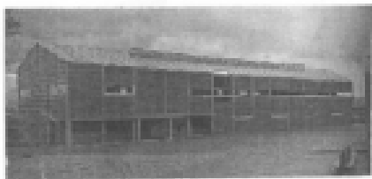
I riferimenti possibili

i luoghi del lavoro individua quei luoghi della città dove sono presenti o previsti spazi dedicati al lavoro di qualunque tipo definiti dalla destinazione i luoghi del lavoro, siano essi uffici, magazzini, laboratori, capannoni industriali, officine o spazi per il commercio. Destinazione principale: i luoghi del lavoro.