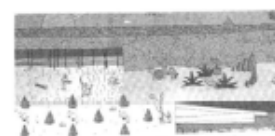
I riferimenti possibili

Le case e lavoro tra via Fabbrichetta e via Cefalonia dovranno porsi in modo da creare fondale prospettico al corso Francia, essere circondate da giardino e porsi in relazione ad entrambe le vie.