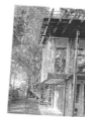
I riferimenti possibili

Per le case e cascine del territorio agricolo sono inoltre ammessi Interventi una tantum così come definiti all'articolo 10.1 delle Norme generali .