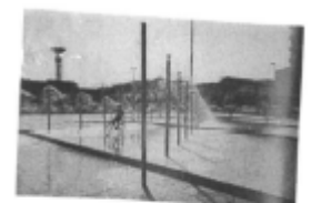
I riferimenti possibili