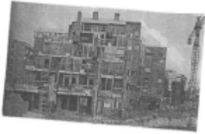
I riferimenti possibili