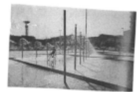
I riferimenti possibili

case basse descrive i luoghi della città in cui sono prevalenti o previste le case con un numero massimo di tre piani fuori terra, con giardino o cortile, affaccio diretto