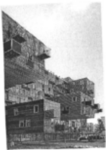
I riferimenti possibili

su strada o arretrate. In questo ambito normativo potranno essere realizzati interventi di modificazione del tessuto edilizio esistente e di modificazione del tessuto urbano. Le case potranno avere numero massimo di tre piani. Le case basse per le quali è previsto l'allineamento su strada, ove sulle tavole di piano sia specificatamente indicato l'allineamento su strada delle case , fatto salvo il medesimo indice edificatorio, potranno avere un numero massimo di cinque piani. Destinazione principale: le case.