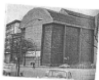
I riferimenti possibili

I comparti comprendono case e servizi. Le destinazioni case alte su strada hanno indice di edificabilità fondiario pari a 1,2 mq/mq. Le aree a servizi da cedere, ai sensi dell'art. 21 L.R. 56/77 e s.m.i., sono pari a 29 mq ad abitante. Dovranno essere cedute aree all'interno del comparto come indicato sulle tavole di Inquadramento normativo fino al raggiungimento delle quantità previste dal progetto. Le quantità da dismettere all'interno dei comparti, sono riportate qui di seguito nella tabella "La modificazione del tessuto edilizio esistente".