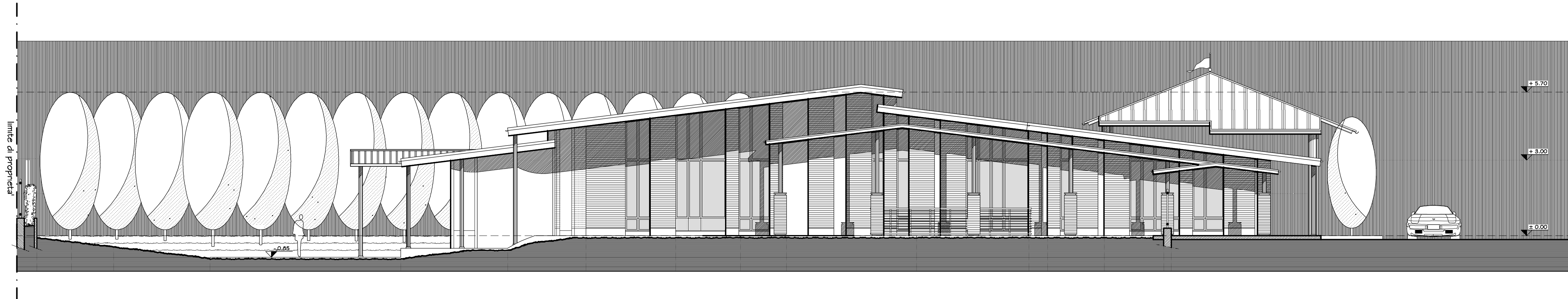
PROSPETTO LATERALE IN PROGETTO - VISTA EST - SCALA 1:100

Elaborato n. 42 Realizzazione di edificio a scuola materna con 4 sezioni e spazi accessori - progetto preliminare - PROSPETTO LATERALE - VISTA EST - SCALA 1:100 -