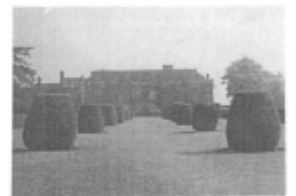
I riferimenti possibili

I luoghi dell'agricoltura individua quei luoghi del territorio agricolo e del parco ove sono presenti o previsti spazi dedicati al lavoro agricolo. In questo ambito normativo possono essere realizzati interventi di conservazione degli immobili ed