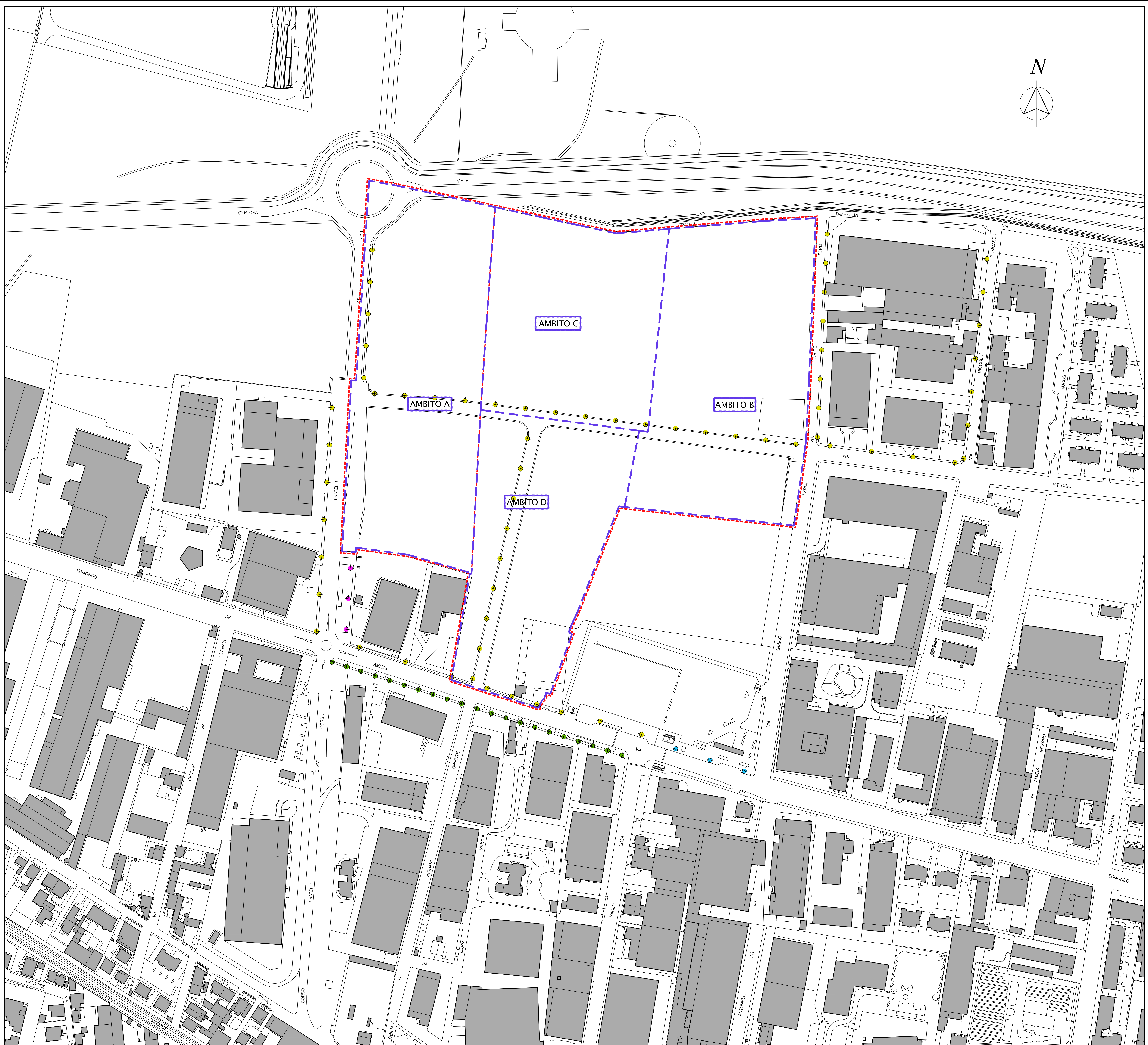
ESTRATTO DI CARTA TECNICA DELLA CITTA' DI COLLEGNO (AEROFOTOGRAMMETRICO) CON INDIVIDUAZIONE DELLA RETE DI ILLUMINAZIONE PUBBLICA ESISTENTE - SCALA 1:1000