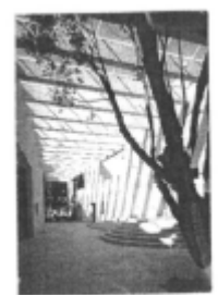
I riferimenti possibili

case e lavoro individua i luoghi della città in cui sono compresenti prevalentemente case basse ed officine, allineate su strada con cortile interno, in cui sono leggibili segni dei tracciati agricoli. Sono caratterizzati da alta densità edilizia derivata dalla successiva aggregazione di manufatti. In questo ambito normativo potranno essere realizzati interventi di modificazione del tessuto edilizio con edifici con un numero massimo di tre piani. Destinazione principale le case.