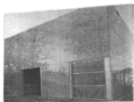
I riferimenti possibili