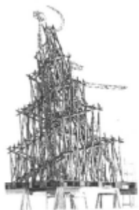
I riferimenti possibili

Il percorso attrezzato a servizi con carattere ciclo pedonale prosegue in via XX settembre lungo il viale alberato dove si affaccia il tessuto di case e lavoro che dovrà mantenere su strada recinzioni a giorno e siepi.